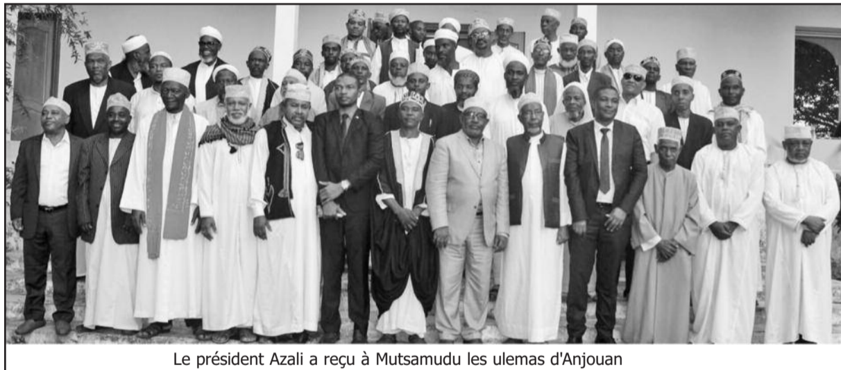
Le président Azali a reçu à Mutsamudu les ulemas d'Anjouan

« Notre religion est une, et ce depuis un millénaire. Notre religion est le ciment qui compose notre