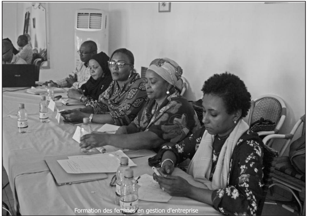
Formation des femmes en gestion d'entreprise