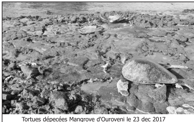
Tortues dépecées Mangrove d'Ouroveni le 23 dec 2017

Aussi convient-il de mettre en place un programme de recherche qui devra fournir les données de base concernant principalement l'identification des populations de tortues vertes, la connaissance de leur distribution, taille et tendance démographique, ainsi que l'utilisa-